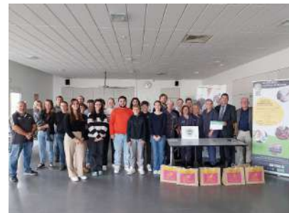
Remise du label Établissement Bio Engagé au collège Robert Schuman à Châteaubriant (44)