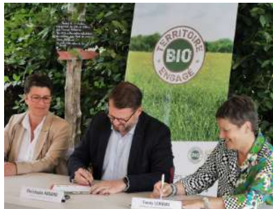
Remise du label Territoire Bio Engagé à la Communauté de Communes du Pays des Herbiers (85)